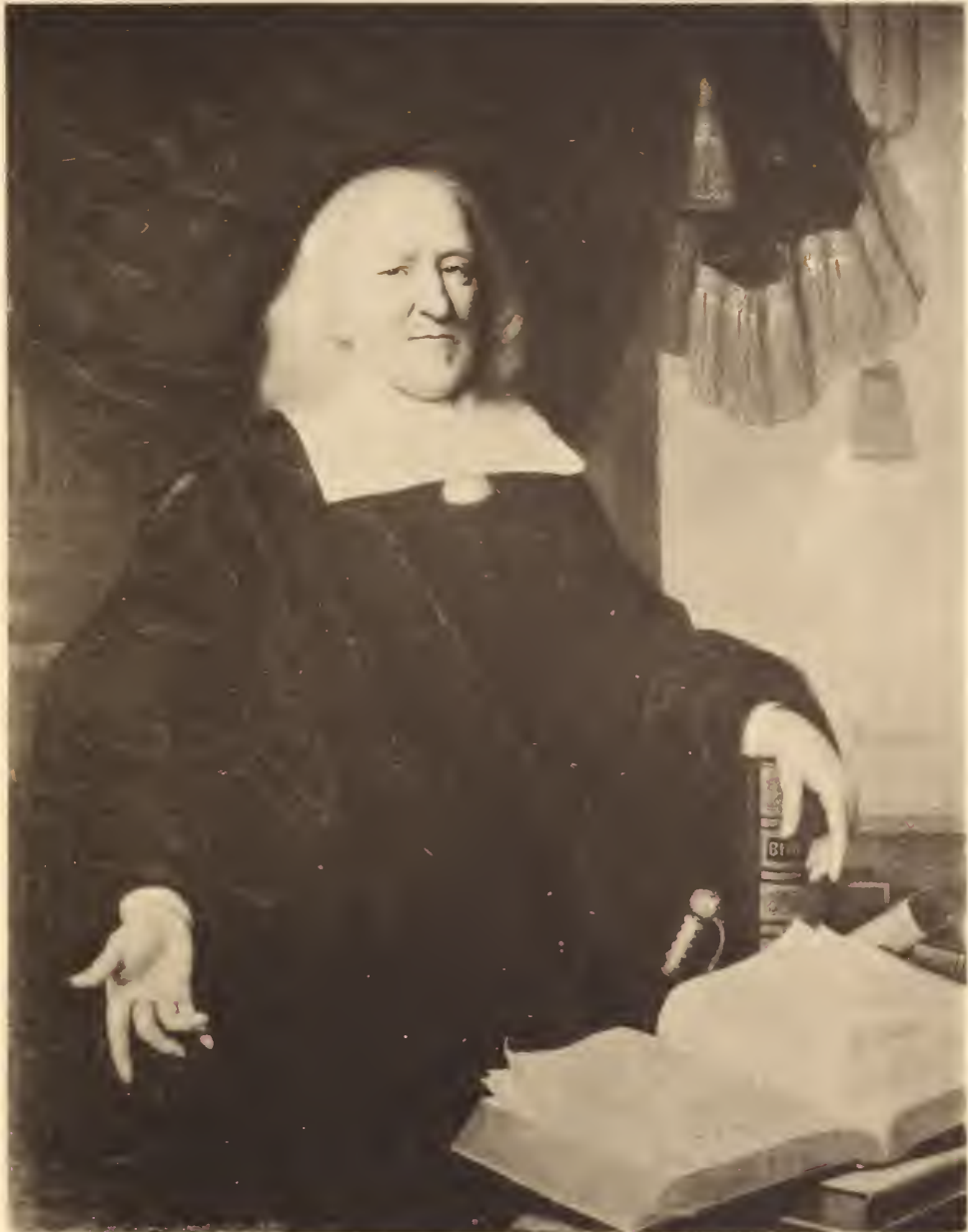
Vente le 23 février 1904, Dir. Frederik Muller & Cie. (Ant. W. M. Mensing).